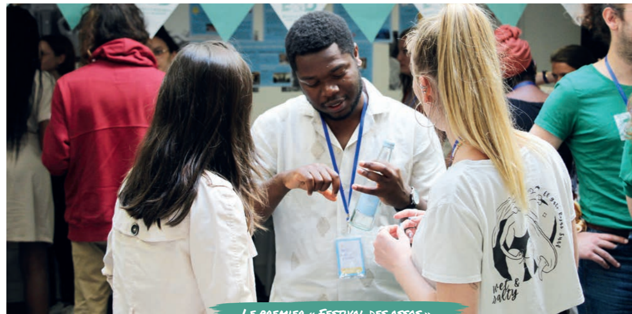
LE PREMIER « FESTIVAL DES ASSOS »